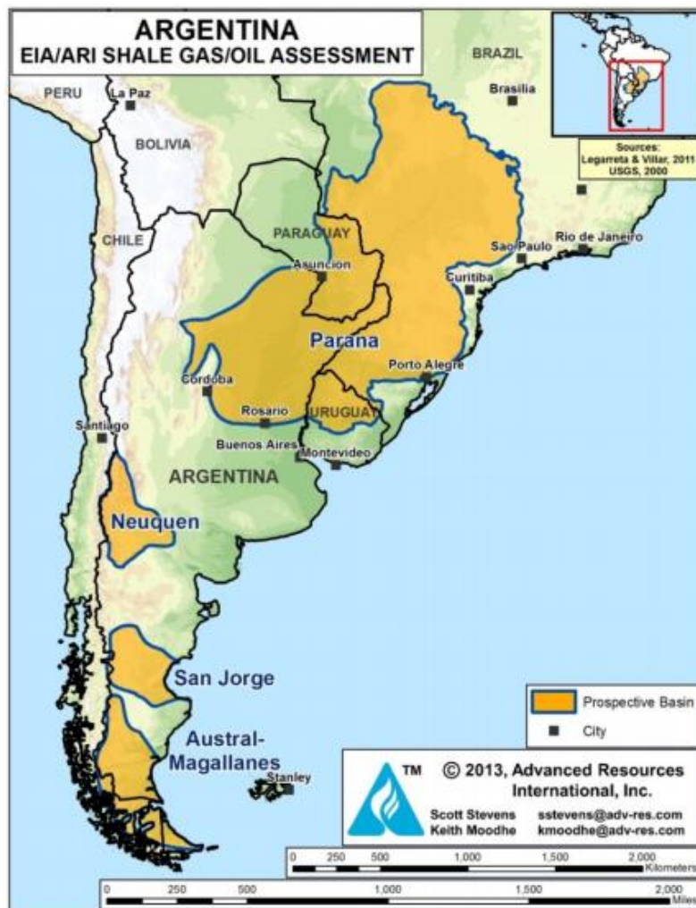
Imagen 2. Reservas estimadas de Shale Gas.

El abordaje que se realiza en este capítulo se apoya en los conceptos desarrollados por Enrique Leff relativos a la economización del mundo .