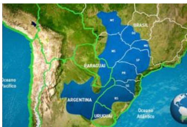
Imagen 1. Ubicación del SAG.

Tiene una extensión aproximada de 1,2 millones de km 2 . Estos se distribuyen de la siguiente manera: 840.000 km 2 se encuentran en Brasil, 225.500 km 2 en el territorio argentino, cubriendo por completo las provincias de Misiones y Corrientes, y en parte a las provincias de Formosa, Chaco, Santa Fe, Córdoba y Entre Ríos. 71.700 km 2 en Paraguay y 58.000 km 2 en Uruguay (Chiesa y Rivas, 2007).