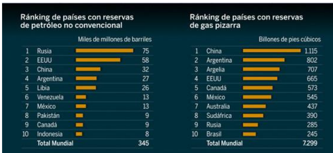
Imagen 3. Ranking de países con reservas de hidrocarburos no convencionales.