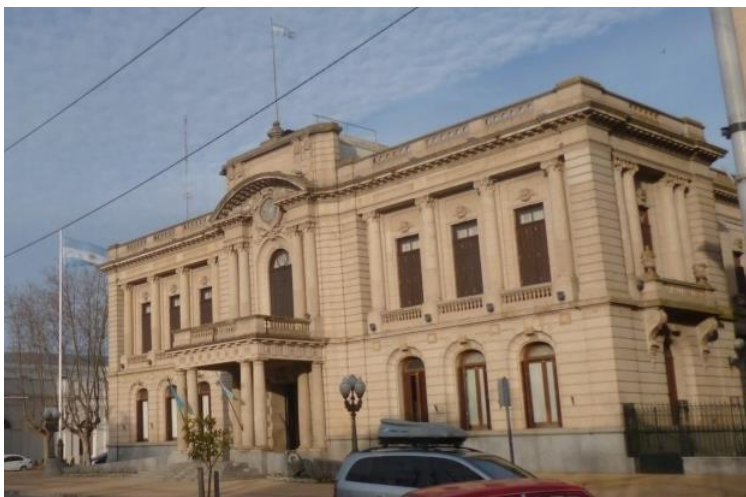
Figura 6: Palacio Municipal (Ing Arq. J. Waldorp-Arq. R.Penacchi). Balcarce.