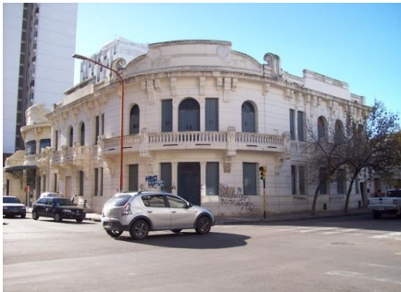
Figura 4: Sede de la Italia Unita. Fuente: Fotografías de GIUSTO, AGOSTINA. Año 2014.

El edificio de la entidad presenta una jerarquización de la esquina al ubicar allí el acceso y un remate más importante. La misma se resuelve con un muro curvo, el que es acompañado en toda su extensión por el balcón de balaustres con grandes ménsulas. Las fachadas laterales presentan balcones similares a los de la esquina, de manera de uniformar el diseño. 28 (Ver Figura 4).