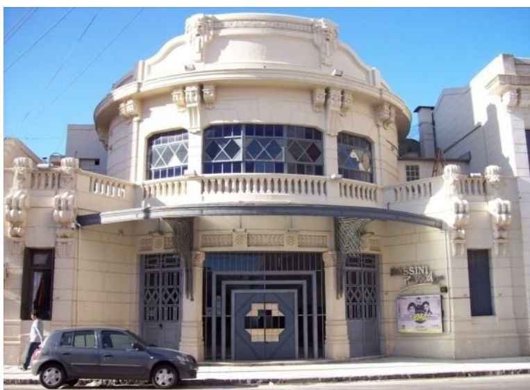
Figura 5: Sede del Teatro Rossini, contiguo a la sede de la Italia Unita. Ambas fueron proyectadas como una unidad.

Es por ello que aun hoy este importante sitio de interés histórico y arquitectónico sigue en desuso y cerrado para el público en general.