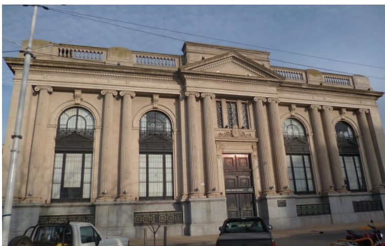
Figura 7: Ex Banco Hipotecario Nacional.