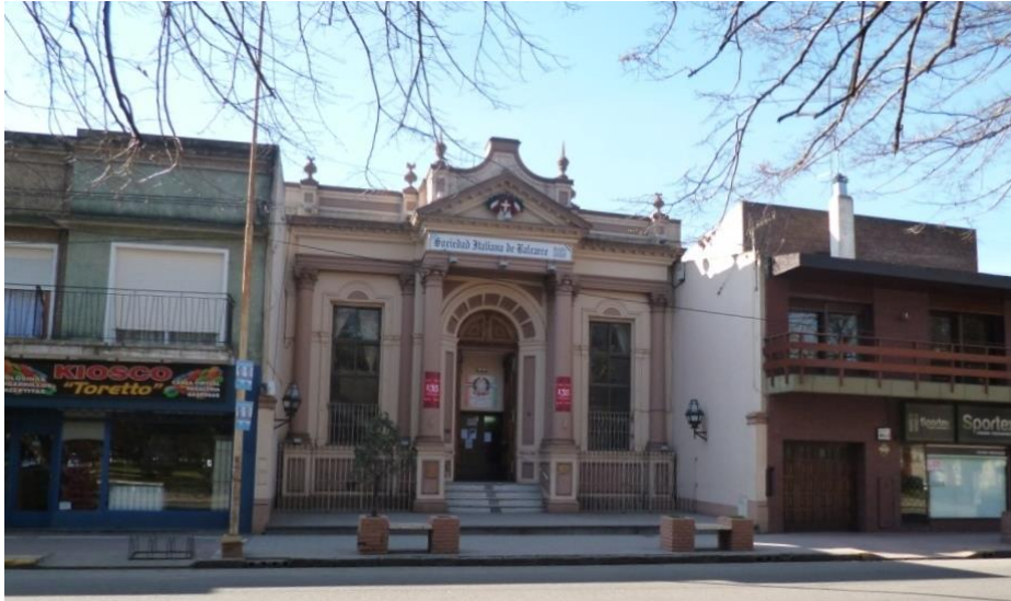
Figura 1: Sociedad Italiana Filantrópica Unida- edificio construido 1896.

Utilizando pilastras y columnas de orden compuesto con fuste liso y pedestal. Enfatizando el acceso principal un frontis conteniendo el escudo de la Sociedad. El edificio se implanta en un lote de doce metros de frente y cincuenta metros de largo, retirado de línea municipal, generando un espacio público propio. (Ver Figura 1).