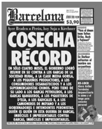
Tapa Nº 131, -28 de Marzo de 2008

Dicha caracterización, que partió de lo general y terminó enfatizando algunos detalles particulares, hace de nuestro objeto una compleja red de operaciones de