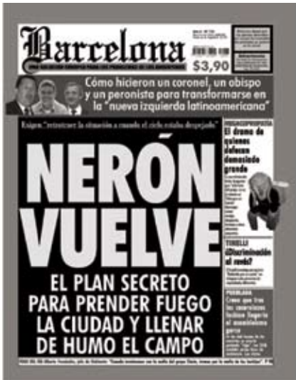
Tapa N° 133 -25 de Abril de 2008-

relación, por la actitud del sujeto (modus/modalidad) ante el contenido de la frase (dictum/lexis) hace del subtítulo una validación que no es necesario reenviar al co-enunciador para su confirmación, sosteniendo así el peso de la predicación.