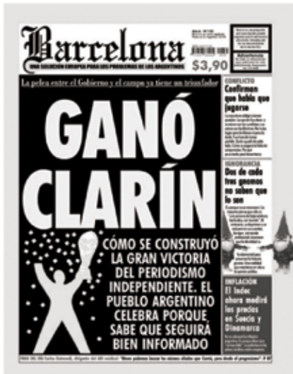
Tapa N° 135-23 de Mayo de 2008-