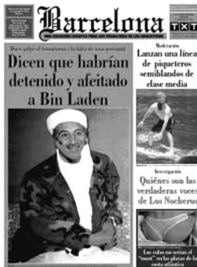
Tapa Nº 21 -26 de Diciembre de 2003-

3-La puesta en página, en la etapa seleccionada