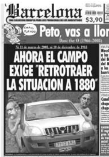
Tapa N° 132 -11 de Abril de 2008-

Teniendo en cuenta la falta de inmanencia inherente a todo proceso comunicativo, esté o no mediatizado, se abre aquí un primer interrogante acerca de la solidaridad constitutiva de imágenes y/o textos en la configuración de "tapa". Tal como plantea Culioli, "la comunicación, entendida como instancia de interacción, se basa en el ajuste más o menos logrado de los sistemas de referencia de los dos enunciadores", 5 lo que hace de la coherencia compositiva del género y del establecimiento "de cierto consenso históricamente situado sobre las significaciones" 6 un modo de atenuar la polisemia de todo discurso. En éste caso, las bifurcaciones connotativas estarán señaladas por el reconocimiento de dichas operaciones y las competencias culturales e ideológicas subyacentes a su