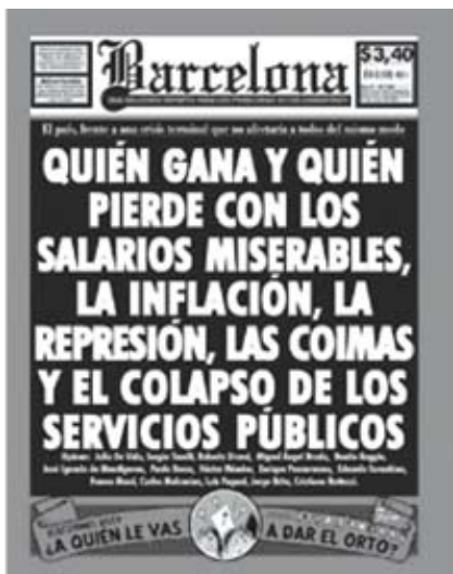
Tapa N° 109 -25 de Mayo de 2007-

para el análisis, reconoce la centralidad de un titular, en tipografía destacada, y la organización aledaña de titulares secundarios. Algunos de estos se reconocen como series temáticas fijas: culos / racismo / gnomos. A pie de página se copia la disposición gráfica que el diario Clarín le otorga a la "Frase del día". Otra recurrencia es la "tapa" anual dedicada a "los personajes del año", parodia intertextual de la que publica la revista Gente .