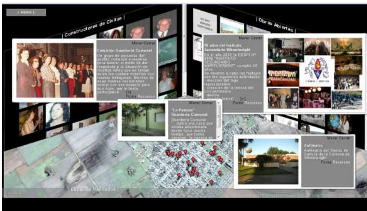
Figura 2: PPE en desarrollo, Creadores de civitas/Obra Abierta/Espacios habitados

El subsistema posibilitó a los ciudadanos visualizar las categorías planteadas, los formatos de recursos (contenidos) a aportar y la metodología para la carga, todo a modo de prueba exploratoria. A nivel del grupo de I+D del CIFASIS, se procedió en primer lugar a seleccionar y especificar metadatos en función de las dimensiones tratadas y luego, se desarrollaron las correspondientes fichas digitales de edición abierta y colaborativa en línea, con su correspondiente instructivo para que los usuarios puedan efectuar adecuadamente y sin dificultades, la carga de contenidos y asegurar así el logro de una efectiva vinculación a nivel de la base de datos del sistema. Atendiendo a los límites del presente escrito las características de operación del DHD Telares de la memoria, se encuentran en la Guía del usuario desarrollada puesta a disposición en acceso abierto en el portal del proyecto http://dimensionesdhd.cifasis-conicet.gov.ar y en la Ayuda del Menú del Libro Hipermedial de la memoria.