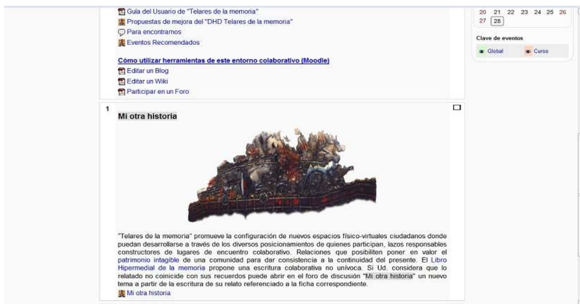
Figura 3: Foro “Mi otra historia” (entorno moodle- espacio Telares de la memoria)

El trabajo de campo que atraviesa el trayecto completo de I+D del proyecto, si bien estuvo centrado en un primer momento, en la posibilidad de construir una cartografía densa de vínculos y relaciones, permitió reconocer las distintas visiones que sobre estos territorios se construyen, algunas anudadas a la condición del actor que lo relata, que lo dibuja y lo describe (Reguillo: 2005). A partir del cruzamiento del material relevado, se comenzó el diseño de “Telares de la memoria”, como una trama posibilitadora del trazado de recorridos y trayectorias singulares donde cada sujeto puede consensuar o escribir otra historia: puntos de conflicto y desacuerdos que podrían habilitar nuevas formas de significar . La siguiente Figura 3, muestra el espacio de discusión “Telares de la memoria” al que se accede desde el enlace Foro de las fichas que se observan en la figura anterior, o desde el Menú del subsistema: “Discusiones”.